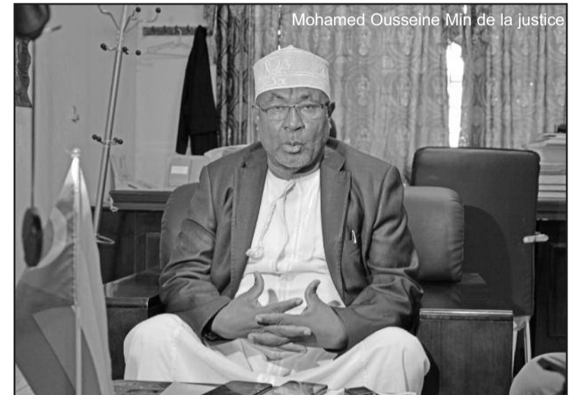
Mohamed Ousseïne Min de la justice

Alors que le gouverneur de Ndzouani, Salami Abdou, est placé en détention provisoire et accusé de 7 chefs d'inculpation dans l'affaire dite de la Médina, le ministre a déclaré avoir apprécié l'intervention de l'avocat du gouverneur qui assu-