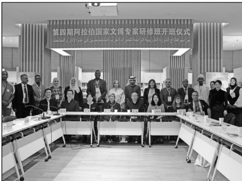
Participants au Séminaire des Musées en Chine

Innovation culturelle et industries créatives en Chine sont les thèmes retenus lors du séminaire des Etats arabes organisé en Chine, du 15 octobre au 3 novembre 2018 et qui a vu la participation des Comores. Un séminaire des musées qui a permis de faire découvrir le patrimoine matériel et gastronomique du pays.